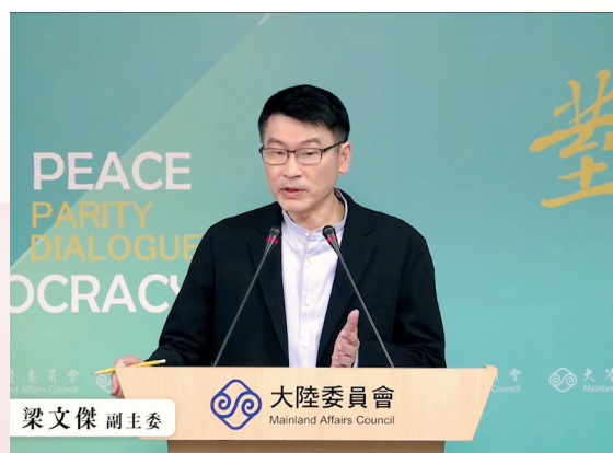
陸委會梁文傑副主委說明，行政院已於9月10日正式核定函頒「行政院及所屬各機關（構）人員赴香港或澳門注意事項」修正案，自發布日起正式實施。

涉及國家安全、利益或機密業務之人員。 （三）受前款機關委託從事涉及國家安全、利益或機密公務之個人或法人、團體、其他機構之成員。（四）前三款退離職或受委託終止未滿3年之人員。（五）縣（市）長。（六）受政府機關（構）委託、補助或出資達一定基準從事涉及國家