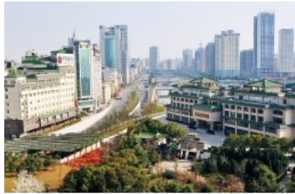
南昌城內高樓林立，看不出古城樣貌。

三月下旬，造訪了江西省省會南昌，它是我國具有兩千多年歷史的名城。少年時代上國文課時曾讀唐朝王勃的〈滕王閣序〉，對滕王閣所在地的南昌有了初步的印象；我還記得年逾花甲的國文老師口沫橫飛地在課堂上解說課文，當講到「落霞與孤鶩齊飛，秋水共長天一色」，一時之間，自己彷彿置身在那深秋傍晚的滕王閣上憑欄遠眺，落霞盡染、水天一色、漁歌唱晚、孤雁南飛的美景，盡都浮現眼前…。可惜書中註釋滕王閣歷經各朝代多次重建，最近一次的修建在清朝年間，卻又於民國15年燬於戰火。