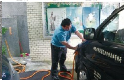
利用雨水洗公務車

一般而言，每逢下雨，「簡易雨水回收再利用系統」的水塔在1小時之內即已注滿，並可經常保持4噸的回收雨水供作多用途使用。如以每週省下4噸用水來計算，每年至少可省下208噸的用水；經年累月下來，可為公家機關節省為數可觀的水費支出。