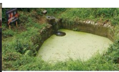
利用雨水灌注消防蓄水池