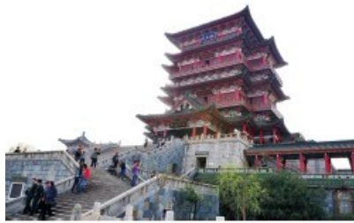
江南第一名樓－滕王閣。

閣中有電梯直達頂層，在此憑欄遠眺，南昌城中景物盡收眼底；滕王閣西側濱臨贛江，黃濁的江水悠悠地流向下游，遠方白雲深處，橫亙著朦朧的青山。斯情斯景，讓人想起王勃詩中最後兩句：「閣中帝子今何在？檻外長江空自流。」韶光飛逝，物換星移，千百年來不變的也只有這裡吧！