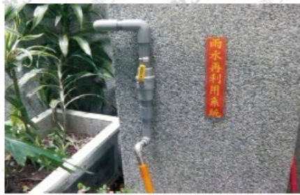
簡易「雨水回收再利用系統」出水口

「簡易雨水回收再利用系統」建造的方式極為簡單，所需花費亦不多，只需採購不鏽鋼水塔、PVC管、球閥、彎頭、直通接頭、三通接頭、內牙彎頭、閘接頭、出水龍頭及固定管夾等材料零件，總經費支出不到2萬元。待組裝完成後，即可利用辦公廳舍的遮雨篷、鐵皮屋頂及既有的排水管路，將雨水集結、導引至水塔蓄積，其所蓄存的雨水即做為再生利用。