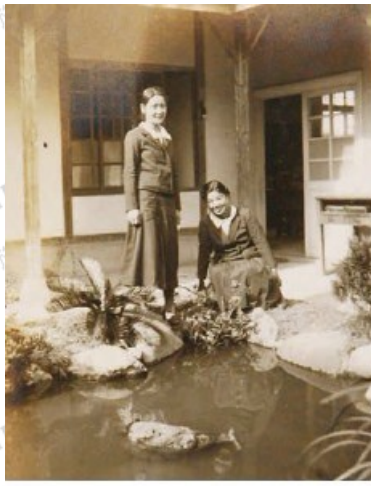
日據時代女學生身影