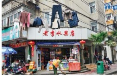
南昌街頭常見民眾在電線上晾曬衣物，他處未曾見過。

南昌街頭交通頗亂，除了重要路口之外，紅綠燈不太多，常見人車爭道的場面；外地人在沒有地下道的地方要過個馬路，得提心吊膽半天。倒是市區內近年綠化做得不錯，路旁人行道和公園內廣植香樟樹，綠蔭籠罩，憑添了許多蔭涼和視覺的美觀。大街小巷中常見居民將衣物掛在電線上晾曬，也不怕可能觸電，這是我多年來走過大陸許多城鎮未曾見過的景象。