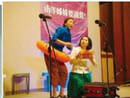
「日久他鄉是故鄉」演出