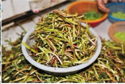
藜蒿－鄱陽湖的草，南昌人的寶。

南昌人嗜食一種生長在鄱陽湖畔稱為「藜蒿」的植物的嫩莖，當地流傳著一句俗諺：「鄱陽湖的草，南昌人的寶」即是指此。三月這一陣子正是藜蒿的盛產期，不僅在街邊、市場到處都看到有賣，平常在餐桌上也常出現藜蒿炒臘肉這道菜；南昌人常很得意地向外來朋友推薦這道時令佳餚。我吃過幾次，口感十分清脆，有些類似山芹菜的莖，但帶有一股淡淡的清香，和臘肉、?菜搭配起來確是一種絕妙的組合；因在別處未曾吃過，特為之記。