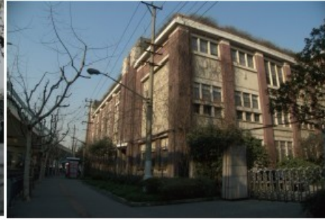
博物院建築今日面貌（2012年2月拍攝）

另例如《中國軟體動物學論叢》，雖然從1934到1945年僅出版了六薄冊的鑑定報告，而且是以震旦博物院的藏品為研究對象，但主要作者包括中國科學社創辦人之一、當時在中國生物學界極負盛名的秉志（1886-1965），以及當時任職於靜生生物調查所的年輕學者閻敦建。1937年南京淪陷後，秉志服務的南京中央大學全校搬遷至重慶，秉志卻因妻子重病臥床，只得續留上海。因為他聲名在外，日人積極尋求與他合作；他為了不為敵人所用，遂改名易容，隱匿行蹤。在隱居期間，他以震旦大學實驗室及博物館為藏身之所，繼續從事研究。