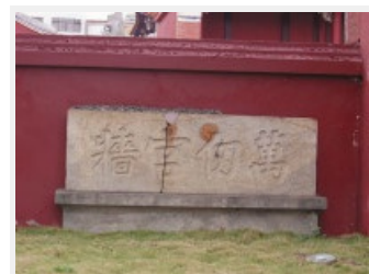
萬仞宮牆 讚美孔子學問道德高

殿前石造月臺，是祭孔時獻佾舞之處，正前方石階中斜面石塊表面刻有雲龍浮雕栩栩如生，月臺梯級九階，月臺上置有石欄杆。殿前置一對泉州白石龍柱，雕刻渾厚古樸，造型雄偉，為臺灣罕見之柱作。屋頂採歇山重簷，脊翹飛揚柔美，正脊上飾以雙龍護塔，垂脊上有「鳴鴉」泥塑，傳說中「鳴鴉」為食父母的惡鳥，用為裝飾，象徵孔子有教無類，能感化惡鳥，於建築中充滿儒家寓意，是孔廟特有的屋脊飾物。