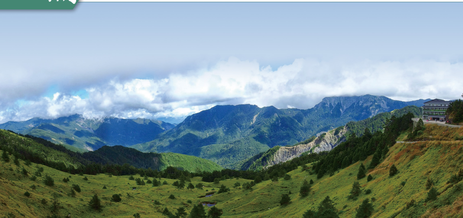
從合歡山拍攝的奇萊連峰，左側為屏風山，右側為奇萊連峰，最右為合歡山松雪樓。

接連攻奇萊主北峰、奇萊主山、奇萊池山、卡羅樓山、奇萊裡山與奇萊主南峰，再經屯原山、廬山溫泉出山，預劃 7 月 19 日週一啟程，週日返校解隊。