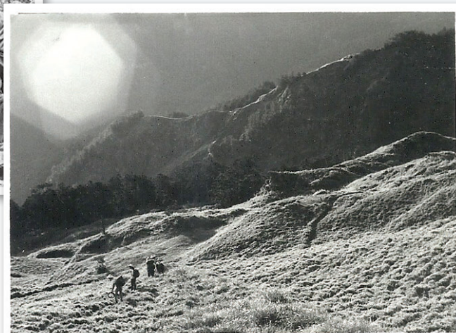
黑色奇萊清華登山隊山難前一日邁向奇萊主北峰留下的光影。