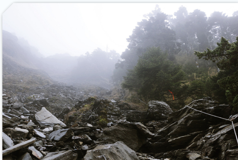
奇萊連峰上下坡加總超過五千米，且當年羊腸山徑岔路多，處處崩塌、路標不明，也沒標向用的拉繩，起霧能見度歸零，迷途風險極高。

直撲臺灣實在說不準。強颱露西已掠過，7 位隊友看著萬里無雲的藍天，照表定行程離校夜宿臺中，隔天搭車經中橫公路大禹嶺，步行十公里抵松雪樓過夜。