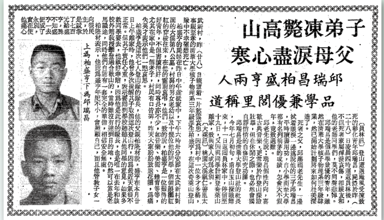
清華大學登山社遭遇山難之新聞報導。

柏盛亨、錢迪與邱瑞昌在黑水塘往小奇萊下方避風躲雨，隨後缺氧窒息。其餘 4 位隊友分別攀爬上坡朝松雪樓奔逃，個個呼吸窘迫，同系的龔士武與吳建昌不幸半途罹難，僅有清華女同學及臺大男同學獲救。