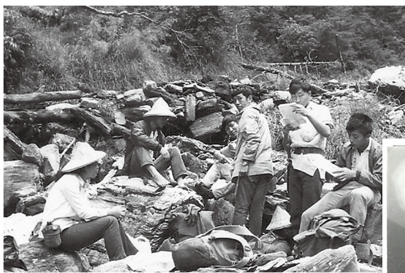
1971年7月23日登山隊員在乾溪用餐身影。

隨後風雨愈發強勁，在黑雲罩頂風雨交加的低視界下，隊友進入凹地內的鐵杉林避風，巨木被狂風連根拔起斷裂傾倒，大夥又奔向黑水塘，窪地變湖泊。14:00