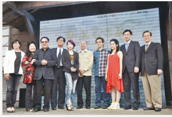
國片「賽得克巴萊」場景公開記者會（右一）行政院新聞局電影處長陳志寬、（右二）行政院新聞局長江啟臣、（右四）「賽得克巴萊」導演魏德聖及其演員等