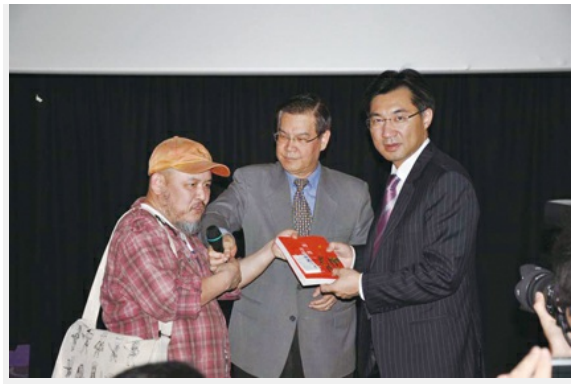
國片「閃閃亮晶晶」公益記者會（右一）行政院新聞局長江啟臣、（中）行政院新聞局電影處長陳志寬、（左一）國片「閃閃亮晶晶」導演林正盛