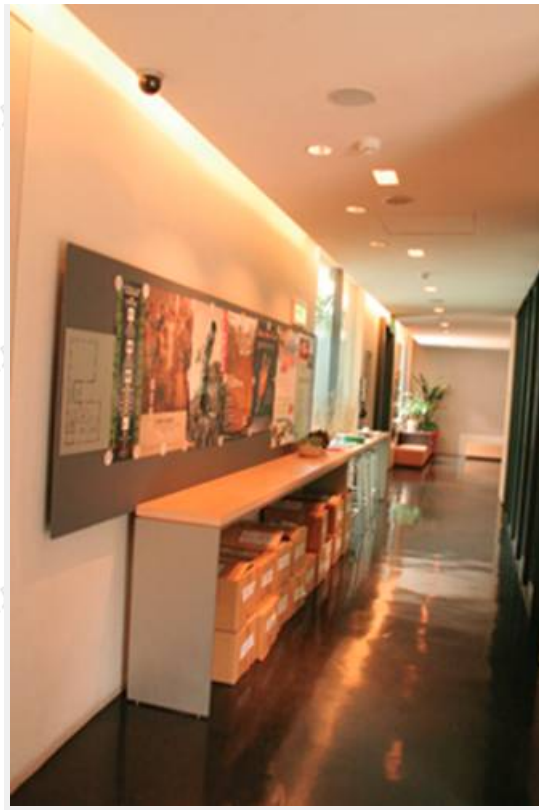
民族音樂研究所走廊