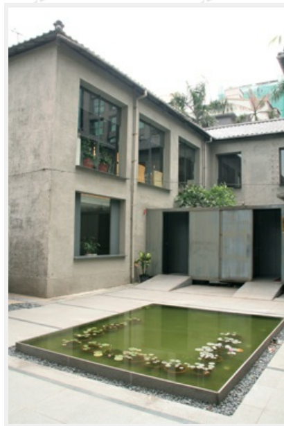
圖1 民族音樂研究所建築外觀

由於都是在不破壞原建築主體的原則下進行的，所以今天，老建築仍洋溢著新意，而新機構亦充分展現了熱情綠意，且成為政府鼓勵「舊有空間再利用」的一個典範，其間的巧思處處可見，散發出民族音樂研究所特有的沉穩與活力。