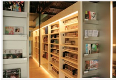
圖5 民族音樂研究內部圖書館景一

另外由於「現代國樂」的興起，包括樂器改良製造、樂隊編制的擴充、樂曲的創新，均呈現出傳統民族特色與現代音樂結合的局面。其交響化的演出形態，與傳統工尺譜不同的記譜、樂曲，構成與西方古典音樂的區隔等，以及在普遍追求臺灣文化主體性的同時，國樂的發展在文化的自省與批判之下，是否清楚地廓清國樂的前進道路；這些課題在民族音樂研究所都有不定期的研討專題講座。