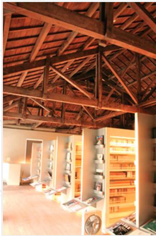
圖6 民族音樂研究內部圖書館景二