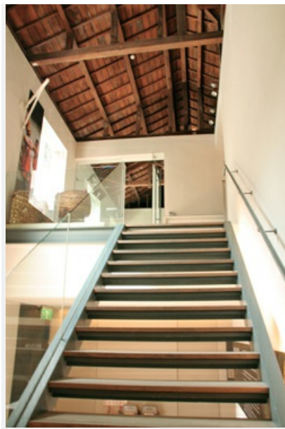
圖2 民族音樂研究所從一樓往上看入口