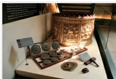
圖3 緬甸的「凸心鑼」，運用於戰場發號施令

民族音樂研究所包含了原住民音樂、漢族音樂以及當代創作，推廣活動開辦至今已邁入第六季，早已在民族音樂愛好者間廣獲好評；針對活動類型，民族音樂研究所也不斷推陳出新，從音樂影帶播放、音樂講座、器樂傳習、教師研習、……到現場講唱會等，希望能藉由不同的模式，讓不僅是學生族群、上班族或是年長一輩的愛音樂人，可以充分享受民族音樂之美，也期待所有愛樂者能以回娘家的心情，重回民族音樂研究所，在雅緻的庭園中享受午後的陽光以及醉人的音樂。