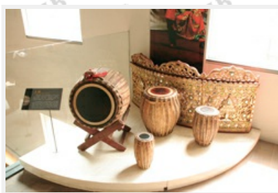
圖4 「主鼓」——左為桑鸞樂團的筒狀雙面鼓