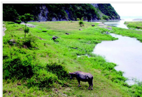
東海岸水牛悠閒自在

豐濱磯崎一帶的水牛養殖數約有七百多頭，是花蓮畜養水牛數量最多的地方；而在加路蘭溪打造牛道與賞水步道，是希望為當地水牛產業創造休閒特色，除提供水牛在溪畔自在喝水、吃草的棲息環境，也讓遊客可以重溫早年農村的悠閒氣氛。