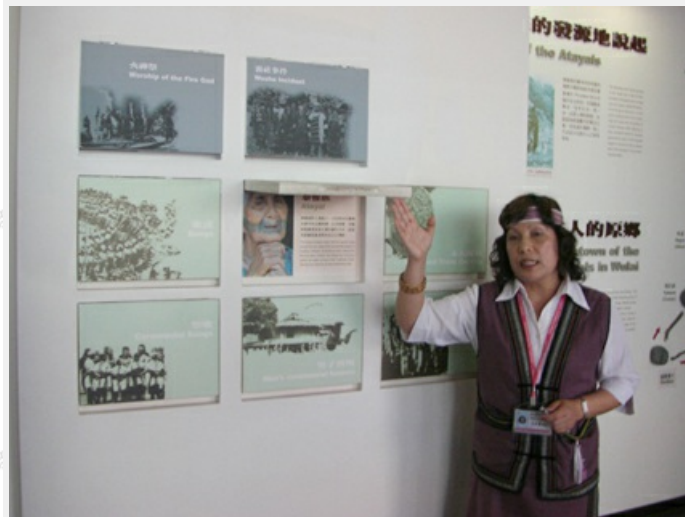
一樓入口區導覽解說情景