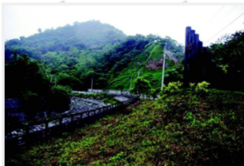
水保局花蓮分局整治豐濱鄉加路蘭溪，打造賞牛步道