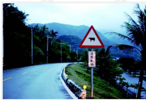
臺十一線磯崎段「注意動物」標誌，正可凸顯當地的水牛產業特色

此外，生態學者也在當地進行長期生態觀察工作，並發現所採行的生態工法，不但有效阻止河床縱向沖刷，讓溪岸房舍和農田獲得保護外，也為當地野生動植物打造了安全穩固的環境，溪畔隨處可見翠綠鳩、烏頭翁、蜻蛉及蝴蝶等動物與昆蟲。