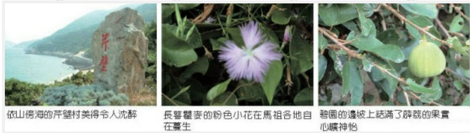
依山傍海的芹壁村美得令人沈醉

午后燦麗的陽光裡，我們租了一輛機車四處「卡溜」（馬祖方言，隨興閒逛之意），道路兩旁遍植正榕、木麻黃、相思樹，還有四處散生的銀合歡等，邊坡布滿五節芒、火炭母草、車前草及蕨類等綠色植被。放眼望去，盡是一片青蔥翠綠，誰說馬祖是個「不毛之地」？