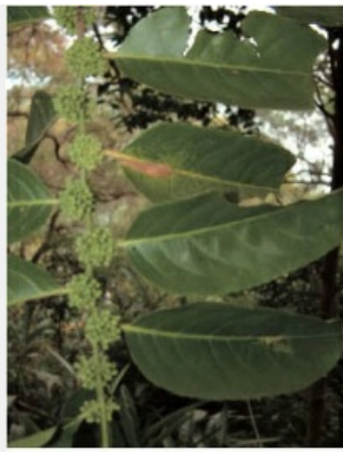
薄葉嘉錫木是馬祖罕見植物