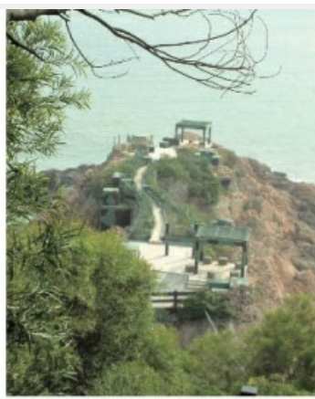
曾為海防前哨的鐵堡如今已成青年男女約會踏青的最佳景點

隨後走訪了鬼斧神工的北海坑道及南竿的最高峰——雲台山登高望遠後，來到盛名遠播的「鐵堡」，這是位於南竿南端一個突出的海礁，早年因軍事需求而將礁岩鑿空，上方再以水泥工事修築覆蓋，據聞這兒也是馬祖當年唯一佩有軍階的狼犬所駐防的碉堡。為防水鬼摸哨，礁岩四周還插上許多玻璃碎片，可以想見早年在駐防的兩棲蛙人戰士們保疆衛土、犧牲奉獻的偉大情操。如今部隊撤防後，鐵堡卻演變成情侶約會或婚紗攝影的絕佳景點。世事多變，能不向早年為國捐軀的蛙人戰士英靈行一最敬禮乎？