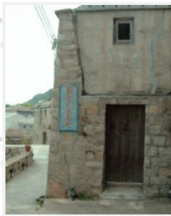
芹壁石屋上還留存著「反共抗俄」時代的精神標語

位於介壽公園內的民俗文物館，外觀雅致，具閩東式建築風格，館內保存有馬祖地區的文物史蹟，從農林漁牧、婚喪喜慶、衣食住行、建築風貌等多角度、多面向切入，是個值得一遊的人文景點。