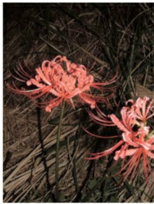
初秋時分嬌豔的紅花石蒜在馬祖熱