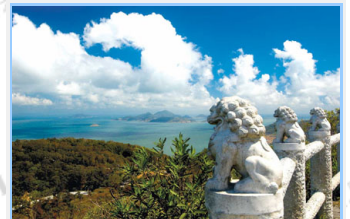
雲臺山為南竿島最高點，天晴時遠眺大陸，街上輪廓清晰可見。

來到馬祖，首先您將驚豔於如此潔淨的空氣，而後是平整的景觀道路，還有那隨處可見的戰地精神標語與營區哨站。深入聚落當中，您必定會為馬祖傳統石頭屋所展現出來的生命力與樸實美感而深深感動不已。偶而在窄小巷弄中，會聽到與閩南語截然不同的福州語對話，更令人彷彿置身另一個國度，忘了這裡是臺灣最北端的一塊領土。