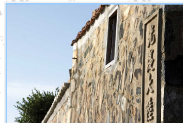
大坵島民居牆上的精神標語

馬祖列島，位於臺灣西北方115哩處，中國大陸閩江口外，包含南竿、北竿、莒光及東引四鄉五島。宛如一串天上灑落在閩江口的珍珠，素有「閩東之珠」美稱，島上多為崎嶇山地，有著迷人的山海之美，卻因地理位置的特殊，歷史際遇的巧合，成為海上的堅強堡壘，籠罩於神秘的面紗之中，直至民國八十一年戰地政務解除，八十八年成立「馬祖國家風景區管理處」以專責開發建設及經營管理工作。馬祖，始展現獨特風貌於世人面前。