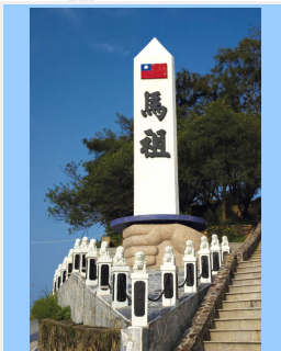
馬祖劍碑為主要精神堡壘之一，矗立在南竿馬港前。

站上南竿雲臺山遠眺大陸，彷彿觸手可及，但身旁巡守的軍人，卻又令人感到對岸是如此遙不可及。如您深入到北海、安東、八八等坑道內部，更會有恍如置身電影場景般的錯覺，令人不敢相信這些龐大、深邃的花崗石坑道竟都是當年以人力一斧一鑿配上炸藥挖掘出來的。