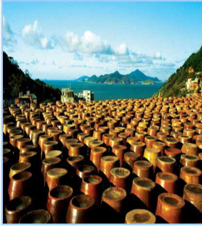
南竿馬祖酒廠，出產的八八坑道、馬祖老酒、陳年高粱酒廣受好評。