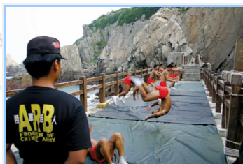
東引北海坑道外的海龍蛙兵們正操演著蛙人操，是我國最精實的戰力之一