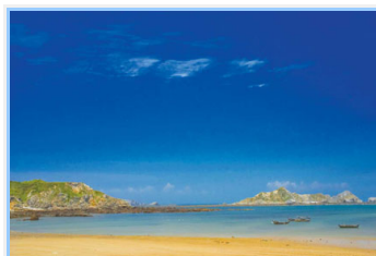
莒光東莒島福正沙灘，盛產花蛤、淡菜、魚蝦等海鮮，東莒人稱「我家的冰箱在海邊」

馬祖傳統建築聚落多集中在各澳口，逐坡而建，錯落有致，屋舍多為獨棟雙層且建物方正的花崗石屋，像一顆印章，故稱為「一顆印式」建築。其建築形式傳承自大陸閩東一帶，但因時空阻隔，逐漸演變為今日馬祖建築特色，如「封火山牆」、「壓瓦石」、「五脊四坡水」、「丁字砌」等。此建築風貌不但與臺灣常見的閩南式建築截然不同，且大陸地區因急速開發，亦將閩東式建築破壞殆盡，保存完整的馬祖傳統建築聚落更是珍貴的人類文化遺產。