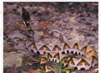
獨角仙飼養簡單，是一般人最熟悉、愛不釋手的甲蟲。

獨角仙是臺灣夏季主要的甲蟲明星之一，和大部份甲蟲一樣是夜行且趨光性的動物，活動時間主要在夜間，雌蟲多在深夜11點後進入活躍期，雄蟲則只要入夜後就會出來活動。由於具趨光性所以在夜間有衝撞發光體的習慣。成蟲的活躍期集中在五至七月，在夏夜稍微潮濕的山區樹幹上，或是腐質土和朽木之中，最容易找到獨角仙。由於獨角仙的成蟲生命非常短暫，一般大約有三個月的生命，唯一的任務，就是交配、繁殖、延續生命。樹上的甲蟲除了獨角仙外，許多的金龜子、锹形蟲等也喜歡吸食樹液，常見他們的蹤跡。在光臘樹上總會聚集許多的獨角仙，除了大快朵頤地吸食樹液外，也會在此尋覓愛侶，完成終身大事。當然在尋覓愛侶時總會有短兵相接，雄獨角仙在打鬥時會將他們強而有力的大角，伸入對方腹下，將其用力挑到半空中，摔到地下。