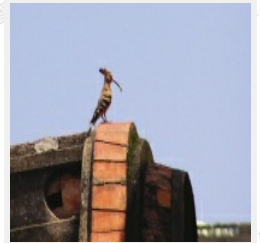
破舊屋舍的屋頂、瓦當以及野外的土洞、樹穴都是戴勝現成的鳥巢。

戴勝屬於佛法僧目，獨立一科，過去認為只有一種。不過最新的研究顯示，位於非洲撒哈拉沙漠以南所發現的戴勝，應屬另一亞種。這一種亞種和歐亞大陸的戴勝，只有雄的戴勝有明顯差異，雌鳥及幼鳥則完全相同。這一亞種的雄戴勝，頭部略帶肉桂色，頭部的冠羽則沒有白色的紋路。而非洲的戴勝則較缺乏社會性，通常是一隻或成對活動。