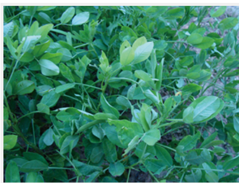
晚上關門睡覺的花生葉

沒有想到，卻因為這樣的舉動，我意外地了解，原來當花生的芽要蹦出來時，那泥土會有裂紋。我見識到生命的力量是多麼的巨大！竟可以請泥土讓路，真是神奇極了。經過泥土蓋住的芽，果然躲過環頸雉的耳目，成功地讓田裡綠油油一片。