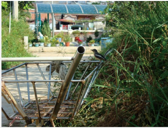
豎起尾巴警戒中的鵲鴿