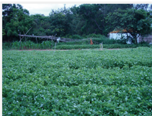
喝飽陽光養份的花生田