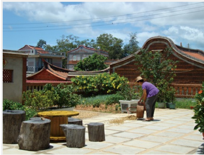
在閩南厝的深井（庭院）曬花生

我就著田埂邊沒有太陽的地方捻「土豆」，誰知金門最會唱歌的鳥「鵲鴝」竟不怕生地來到一旁，跳上跳下。牠可能在花生藤蔓中找到牠的最愛一蟲蟲，所以牠們是農作物的好醫生。我則近距離地捕捉牠的神采，那炯炯有神的眼、銳利的目光，讓蟲兒成為嘴裡的美食。雄鵲鴝有黑白對比的羽色，在陽光下特別地耀眼；若是白與灰的溫柔搭配，那就是雌的鵲鴝。當有一雄一雌時，那雄的會宛轉鳴唱，牠是鳥類中的歌唱家，是很會唱歌的鳥哦！