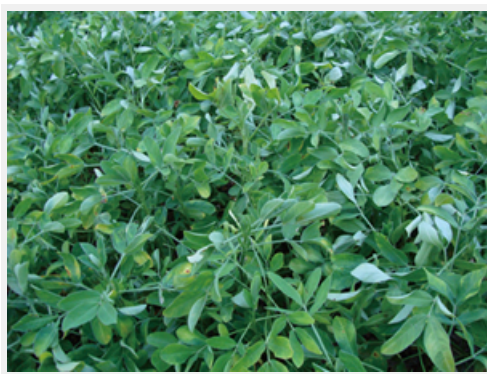
木蟲葉的花生（可以採收囉！）