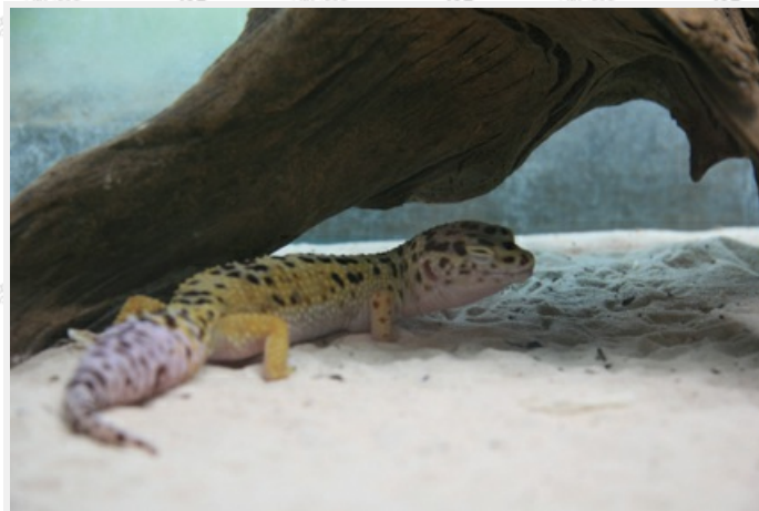
中亞地區豹紋守宮

執行長談到自民國93年該中心成立以來，協助收容的動物包括哺乳類、鳥類、兩棲類、爬蟲類等達100種、超過一千隻以上的個體。牠們的來源大都是消防隊或縣市政府捕獲逃逸的動物，海關沒收禁止的保育動物，還有本土野生動物與日益增多的外來種，更有民眾因為動物個體或食量過大而棄養的動物。