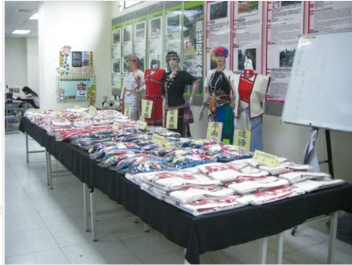
原住民傳統服飾創作班的成果

為了推動原住民傳統工藝文化的保存與傳承，會館利用綜合教室，與勞委會多元就業方案結合，開辦織布、雕刻、藤編、服飾製作及拼布等多元就業課程，將輔導就業與文化傳承結合推動，不定期進行成果展示，相當成功。同時對散居於桃園縣各都會區的原住民青少年推展母語教學，並利用假日時間開辦原住民母語教學班。另外，與在地原住民社團結合，提供各原住民社團舉辦活動及教育訓練使用。該館確實已成為多功能的文化會館。