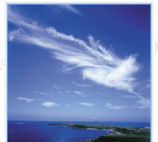
澎湖碧海藍天令人心身舒暢

澎湖國家風景區遊憩系統區分澎湖本島、北海及南海三大遊憩系統：澎湖本島遊憩系統以參觀人文古蹟、軍事遺蹟、自然景觀及近岸沙灘親水活動為主，並且處處可見蒼翠的崗丘草原上牛群幽遊，偶有菜宅（蜂巢田）摻雜其中，勾勒了純樸克儉的農村景象；北海遊憩系統則有東海的碇鉤嶼、雞善嶼及小白沙嶼等玄武岩地質地形景觀，且是燕鷗科鳥類重要棲息地之一；獨具特色的目斗嶼、吉貝嶼、險礁、澎澎灘等沙島及沙嘴，是浮潛或從事海域遊憩活動最佳的場所，吉貝嶼、員貝嶼與鳥嶼獨具漁村風情，都是難得的體驗；南海遊憩系統以地質地形景觀、漁村與人文風情為主，每一處景點都有一個神奇、動人或淒涼與哀怨的傳說，讓遊客參觀之餘，不禁要讚嘆上蒼造物之神奇卻也留下一些人間相思。