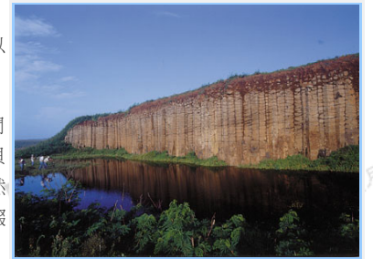
大果葉柱狀玄武岩節理景觀

澎湖由大小64個島嶼所組成，海岸線曲折蜿蜒，長達三百餘公里，島嶼四周多斷崖絕壁，港澳縱橫盤踞，間有沙灘交錯，自然景觀極具特色：不受污染的湛藍海水、變化多端的海底景觀、迤邐數千公尺潔淨優美的貝殼沙灘、節理嶙峋的柱狀玄武岩，棲息或翱翔於海上的群鳥、多樣性的潮間帶生物等，均讓人感受到大自然的浩瀚無窮，進而忘卻塵世的紛擾；澎湖的綠野陽光，萬里晴空，朵朵白雲襯托的碧海藍天，點點風帆點綴著，儘管夏日炎炎，如織的遊客仍抵擋不住尋幽訪勝與追求大自然、漫步在沙灘或在濱海與魚兒悠游的誘惑。