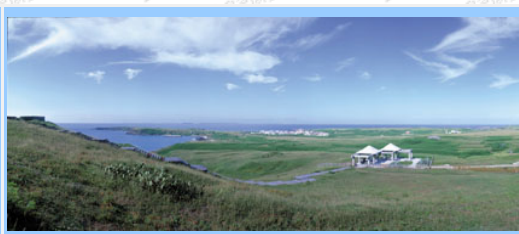
望安天台山崗丘草原