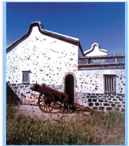
以玄武岩為建材的民居建築

澎湖群島因為板塊運動效應造成地殼擠壓產生裂隙，高壓與高熱的岩漿從裂隙中溢流噴出，熾熱熔岩受地表海水與冷空氣急速冷凝作用下，逐漸冷卻凝固，經過無數次的地盤沉降生浮，形成了澎湖群島特殊的玄武岩地質地形景觀；由於熔岩流在冷卻過程的營力與均質程度等主客觀因素影響，凝固的玄武岩一般成多邊形的柱狀節理與板狀裂理奇景。以南海的桶盤嶼、池西及大救葉的柱狀玄武岩最具特色，東海的錠碇嶼、雞善嶼及小白嶼玄武岩並已規劃為玄武岩自然保留區。澎湖群島的海岸線地形蜿蜒曲折，海蝕現象變化極大，以風櫃的「風櫃聽濤」及小門「鯨魚洞」為玄武岩傳說多了一份生命力。