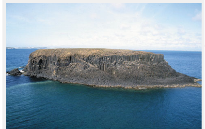
玄武岩自然生態保護區之一雞善嶼

澎湖子民在浩瀚無際的大海中，孕育出寬廣的心胸，讓藝術創作者源源不斷創作的靈感，他們運用靈巧的雙手，巧得天工，將玄武岩石材賦予生命與活力，雕塑成屬於他們智慧的結晶，創造饒富地方色彩的藝術文化。