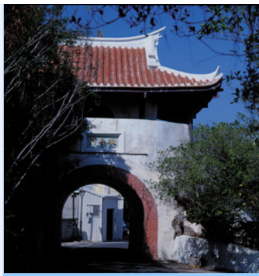
國家二級古蹟順承門

它的歲月風華；每當遊客駐足觀賞，不禁令人身心舒暢，一股振奮與高亢的生命意識，油然而生，是激發生活意志力的源泉。