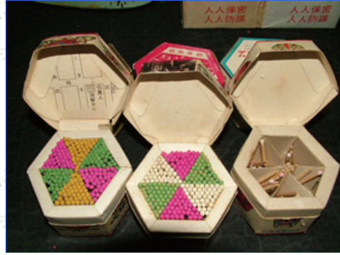
獨特的六角火柴盒：蔣敏全提供