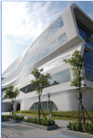
國立公共資訊圖書館新館

配合政府組織改造，本館自102年1月1日起正式更名為「國立公共資訊圖書館」。未來除將繼續提供全國民眾體現「虛實合一、一如親臨」的圖書館服務以外，並將更深切地期許能成為民眾探索知識的領航者、平衡數位落差的實踐者、深耕全民閱讀的推動者，充分結合並運用各級政府機關、學校、民間企業等單位資源，同時連結全國各層級520所公共圖書館，有效運用此「通路」，傳播公共圖書館各項服務資訊，並提供各公共圖書館各式學習與體驗的「平臺」，共創公共圖書館服務價值，實現全民閱讀的願景。