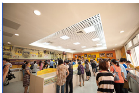
民眾參觀臺灣火柴故事館情況