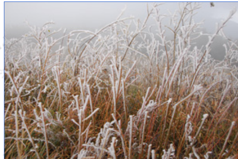
枯草上的霧凇