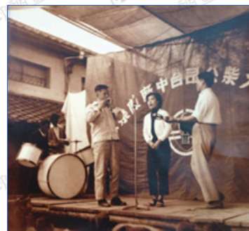
臺火公司的文康活動