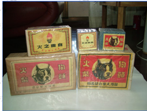
大、中、小封的火柴