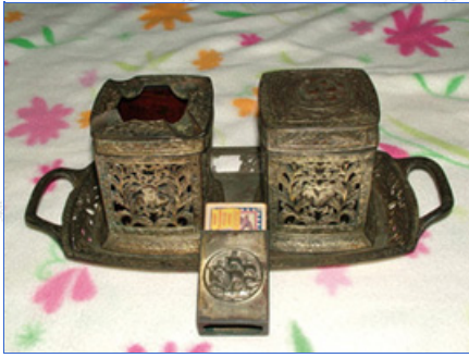
貴族使用的火柴煙具