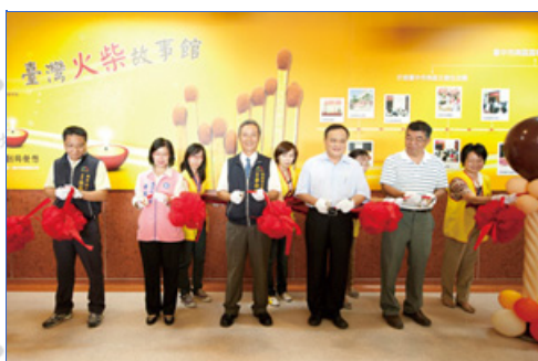
臺灣火柴故事館的開幕剪綵活動