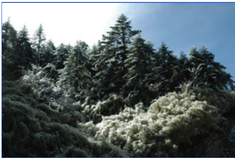
積雪的臺灣冷杉