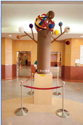
臺灣火柴故事館的火柴幻想樹