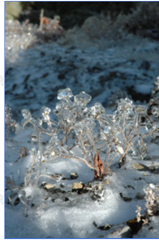
高山植物枝葉結著一層冰