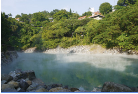
地熱谷有「磺泉玉霧」的美稱