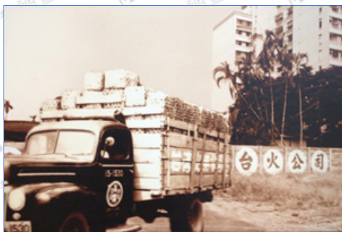
位於臺中市南區的臺灣火柴公司

文化的保存與維護，是一種長時間的艱辛挑戰，要喚起文化的印象，需要大眾的共鳴與努力。近年來，隨著民眾人文素質的不斷提升，對於文物保存的概念已有長足的進步。而今，社會已由農業的臺灣、製造的臺灣，走向科技的臺灣和文化的臺灣，產業終有消逝的一天，期許傳統文化能夠重生與長存。