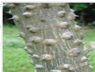
茱萸幹上滿布尖銳瘤刺。 (攝於臺北植物園)