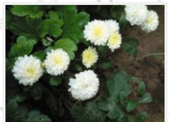
清麗脫俗的雛菊惹人愛憐。 (攝於臺北士林官邸)