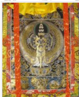
千手千眼觀世音菩薩（黑底）

因此，教育電台特別為小朋友製播一系列優質的節目，包括幼教節目「寶貝媽咪QQ屋」，兒童節目「跟著故事去旅行」、「童YOUNG來FUN電」、少年科學教育節目「少年哈科學」。此外，推動親子共讀的「閱讀娃哈哈」、「古椎柑仔店」、推動衛生教育節目「兒童健康週記」及「魔法兒童」等，6月1日起更邀請蘋果姐姐為國小同學開闢「典藏童年」的廣播節目。