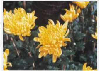
金黃亮麗的菊花滿園盛開。 (攝於陽明山)

我中華民族歷五千載，孕育了悠久的歷史及高度的文明，祖先傳承了許多有益、有趣的節日，這些歲時節俗，往往亦伴隨著歷史傳說或神話故事，使節日蘊含著動人的浪漫色彩。「重陽節」正如同其他節日一般，像歷史長河中蕩漾而起的一波波浪花，持續的氤氳而翻騰。今重九登高的習俗，已從古代的「登高避禍」轉變為後世的「登高健身」及「敬老崇孝」。因時代的不同，人的想法也不同，風俗習慣亦隨之變異，但無論如何轉變，我中華五千年文化及既成之史實將永不改變，正如同王維的《九月九日憶山東兄弟》一詩，將永久傳承於後世子孫孫！