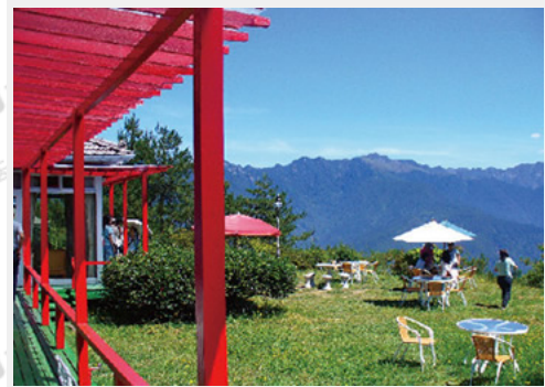
福壽山莊後花園可俯瞰梨山斷層