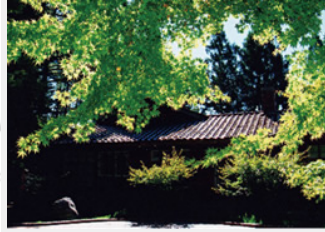
天池雪景-此區常可欣賞臺灣難見之雪景