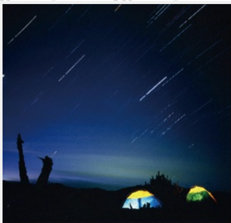
露營區星空浩瀚流星點點

露營區、天池等地點是臺灣地區難得一見、廣受天文學會人士所讚嘆的觀星地點。當繁星點綴著沒有光害的夜空，請您帶著星座盤，鋪張墊子或蓆子，裹著毯子躺著或在觀星亭仰望，各季星座將會伴您度過一個難忘的夜晚。