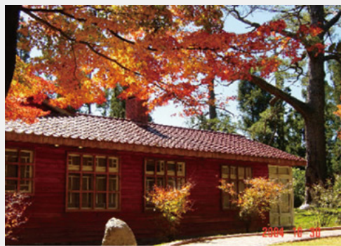
松廬楓紅—已成為攝影團體活動重要景點

松廬是一座三合院式木造建築，為經國先生當年督導巡視中橫工程常駐宿所。位置居中又在高處，為農場場員住所，唐、宋、漢莊場部環繞，後靠山丘座東面西居領導地位；四周種梅、楓，到秋、冬景色特美，尤其楓紅與建築紅牆紅瓦相輝映，冬天梅花紅、白、粉紅，各色繽紛，在後山介壽亭與蔣公銅像兩旁梅花朵朵，屋內景觀古樸、雅致，目前開放給一般遊客住宿。