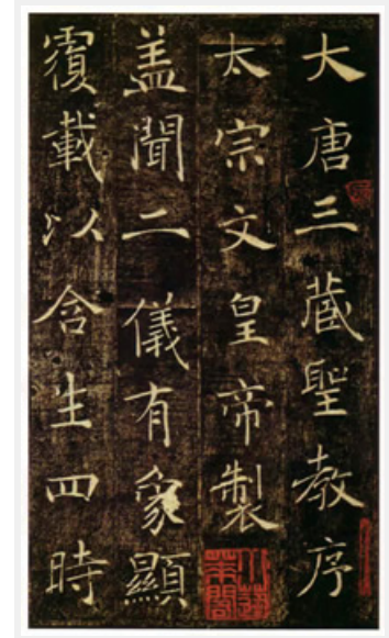
唐朝褚遂良雁塔聖教序，線條優美，柔中帶剛，以行書筆意入楷，流動而空靈。

學習書法，會使個人的文字書寫意念與技巧同時進步，增益美感經驗，尚友古人優良風範，結交同道砥礪書藝，進而提升心境和品性。筆者曾數次前往日本參訪書法活動，發現日本學習書法（書道）人口眾多，有些縣分的書會成員甚至比臺灣全部書法人口還多。他們從小學階段起施以懸腕寫掌型以上的大字，可使小朋友較敢拿筆書寫，再則從寫大字的較慢線條流動中思考如何操控筆桿與帶送筆劃，加上大人經常鼓勵，多數人從小就在書法活動中學習細膩、沈著及做事用心等本領。日本書道源於中國，風格粗分三派，各有勝場，其漢字派有些書家臨寫中國古帖的功力著實令人驚歎折服，況且千百年來日本皇室將書道列為貴族成員們必修必備的才藝之一。凡此可知，書道在日本受重視的程度，確實早已形成一種既貴族又平民化的文化藝術活動。