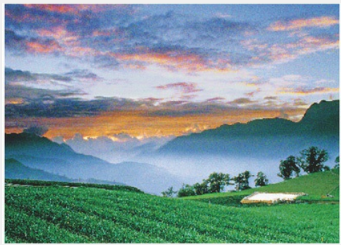
茶園晨曦日出景貌

觀日出最佳點位於天池，當陽光乍現，一縷縷的金黃色如絲線般從雲邊漫開，投向雲外、山邊，以及觀者悸動的眼帘。金色絲線為雲朵鑲上燦爛的金框；若雲層薄一點，就整片轉為金黃。待金色圓球終於露臉後，陽光瞬間照亮山谷森林，氣象萬千。