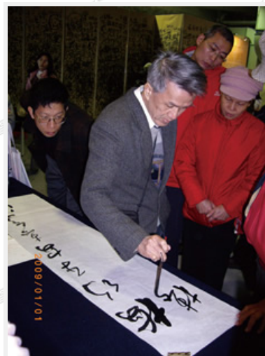
展覽會場欣賞書家揮毫，可吸收書寫技巧

筆者有位書法同道就讀臺大法律系期間，鍾情於書法研究與創作，以致刑法、民法、國際法等專業科目「諸法皆空」，加以拜師習字、天賦與努力，畢業前已獲全國大專組首獎殊榮，如今是經常搭飛機南北往返從事書法教學的專業書法家，確實享受其「自由自在」生活。雖然一個人要自由自在，未必要與書法有關，但書法樂趣就在於能從執筆書寫多種字體文字中，賦予筆劃線條的生命力及漢字不同的造型意態，並將個人的思想、經驗、學養等元素，經由線條表現出雅緻、秀麗或拙趣等風格的抽象化文化涵養，自然可以輕易享受放空自在、有文化素養的生活品質。