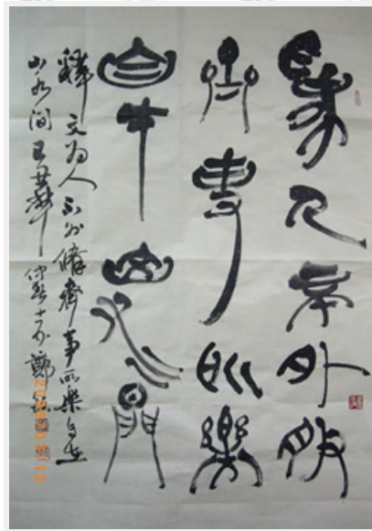
「為人不外修齊事、所樂自在山水間」以篆隸草行諸體融入書作，布局造型豐富，並強調線條流動效果。