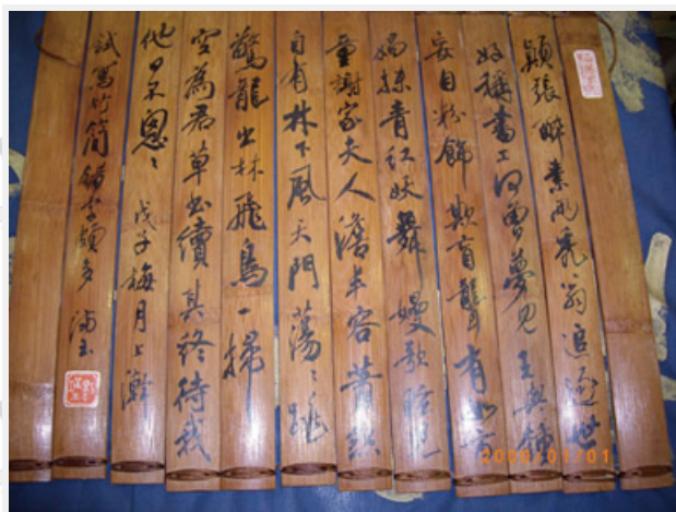
仿古代竹（木）簡形式，既實用又可當居家裝飾品

古代書論家認為寫書法可以「達其性情、形其哀樂」，唐朝書評家張懷瓘曾說書法是「無聲之音、無形之相」，長久以來人們亦有「見書如見人」、「字如其人」的看法，清末民初梁啟超稱書法是「表現個性的最高藝術」，即與古人「書為心畫」的觀點遙相呼應，在在說出了書法所包含的素質及功能。內行人知道，練字即在「練心」、提純「心境與人品」，心清則風規自遠，心靜則易通達思緒事理。試問，那些才藝項目具備如此好處而能夠不需昂貴花費可以輕易獲得呢？