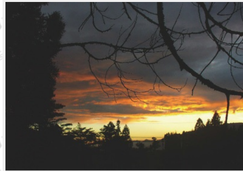
唐莊日落頗具詩詞意境