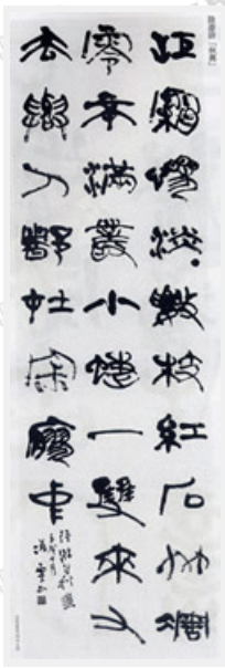
「江霜滲淡數枝紅、石竹凋零不滿簾、小蝶一雙來又去、與人都在寂寥中」日本名家今井凌雪書作，以古人今，對比強烈，具視覺藝術效果。

書法是在古代人民生活及歷代書家耕耘中不斷去蕪存菁，得到了昇華和成為一門藝術。它最初是由溝通需要的文字記載，逐漸演化成高尚的審美意識活動，如今成為一種結合形象思維與精神靈感的特有藝術。它的本質高尚，但並非高不可攀，因為平凡百姓都可接觸，販夫走卒亦可提筆揮灑。它也是貴族活動之一，享受高雅的藝術浸濡層次同時展現文化品味，更是一般民眾抒發胸中塊壘的文化體現場域。因為書法中的一筆一畫，是書寫者個人想法、心靈、學養及生活經驗的瞬時綜合表現，透過筆墨工具及手寫技巧瞬間反應出來，加以寫出線條的律動和質感中極大成分蘊藏著個性與涵養，無怪乎大畫家畢卡索為之著迷。我們對於藝術認知容或不如下大畫家，但能靜心、安詳地練寫一手好字，自娛娛人，讓人看了感覺舒服、有生命力，當是美事一樁。而且如能經常練字、寫字或欣賞書法藝術，對個人養成心性平和及累積文化涵養，是無法言喻的。