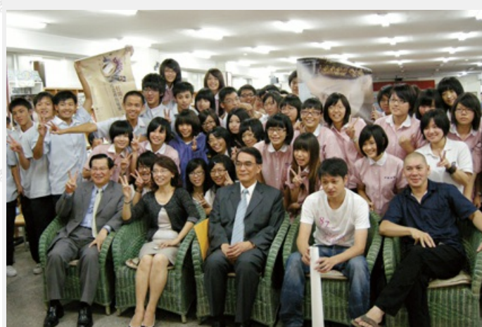
第三屆「98年國片影像教育扎根計畫-全國中學生電影研習營」開跑記者會，行政院新聞局許副局長秋煌、陳處處長志寬，導演蔡明亮、鄭有傑與明倫高中學生合影。(第一排中間為行政院新聞局許副局長秋煌、右一為導演蔡明亮、左一為行政院新聞局電影處處長陳處處長志寬、右二為導演鄭有傑)

旗艦計畫的目標是希望在5年內讓國片在大陸市場比率達到6.9%。除了提供業者拍攝兩岸合拍片所需的資金與援，及政策性協調進入大陸市場外，並透過提供市場資訊、創意開發、行銷平台等計畫，策略性協助業者解決開拓華語市場所面臨的問題。此外，旗艦計畫亦針對我國電影工業及人才的發展與培養，進行輔導與扎根的工作，期望塑造我國電影產業的優質環境，做為我國電影產業發展的堅實基礎。