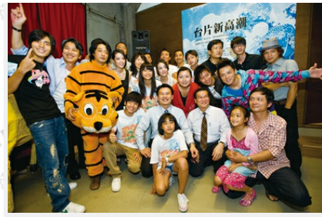
98年臺片新高潮記者會，行政院新聞局蘇前局長俊賓以及電影處處長志寬，與臺灣電影人才齊聚一堂。(第二排右三為行政院新聞局蘇前局長俊賓、第二排右二為行政院新聞局電影處處長陳志寬)