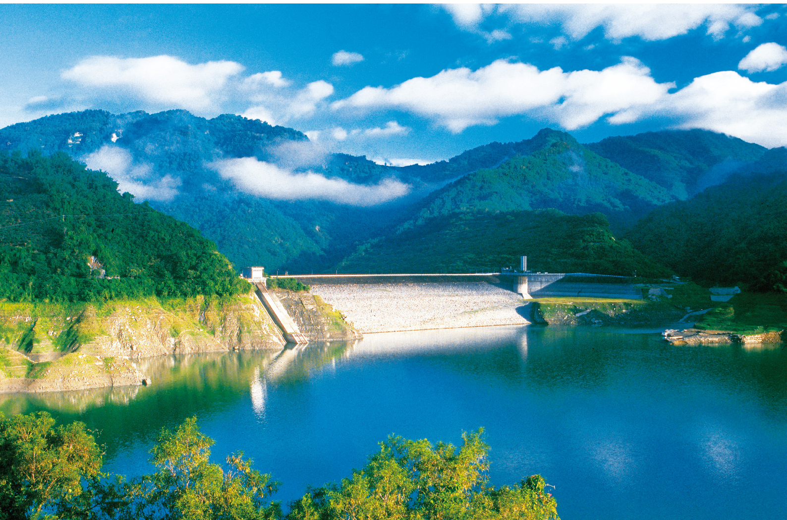
曾文水庫是臺灣面積第一大的水庫，位於嘉義與臺南交界的柳藤潭峽谷，水源保護區內環境原始，水面重巒疊翠。

重要基礎設施，包括各香港地標建築物、領事館、醫院、大型公共運輸系統、水塘、電廠、煤氣庫、銀行及電訊體系等等。