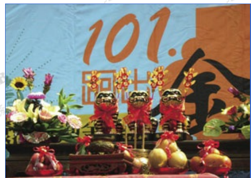
農曆6月6日為虎爺之誕辰日，奉於壇前接受眾人祭拜。