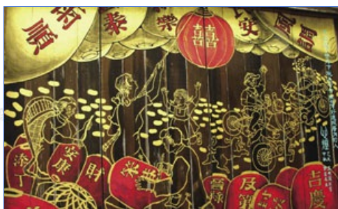
廟旁的街道更顯當地文化特色