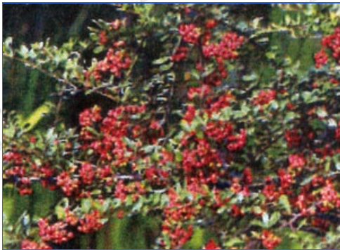
臺東火刺木 (俗稱狀元紅)

校園擁有農田、畜牧場、草原、池沼及樹林等多樣的生態環境，適合民眾、親子及學生前來觀賞；同時每日晨、昏開放校區供民眾前來運動。惟籲請民眾發揮公德心，勿任意摘折花朵、植株、葉片、果實等。