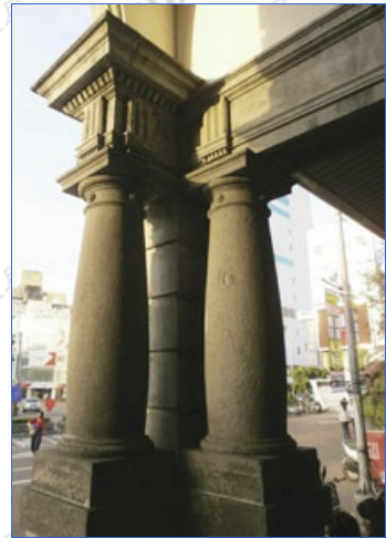
新竹火車站的外部樑柱具有歐式的建築素材