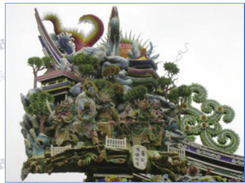
屋頂鮮艷色彩的交趾陶極具藝術價值