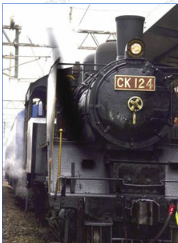
88歲的CK124老火車頭現身於100歲的新竹火車站