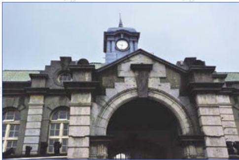
沒有掛名牌的新竹火車站有一座四面時鐘的鐘塔

新竹火車站為新竹市歡迎外賓造訪的大門，同時也是新竹市民重要的共同記憶處所，舉凡喜迎外地遊學歸來的學子、淚送前往異鄉當兵的子弟等等，許多感人的故事都在新竹火車站裡發生。如今，新竹火車站已邁入100歲重要的新里程，請大家到新竹市時，別忘了去看看這座沒有名牌的火車站，同時也能衷心地祝福這座老車站的建築能夠長長久久，繼續服務送往迎來的遊客，並為世人展現她的古樸與風華。