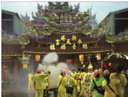
「開臺媽祖」的奉天宮為歷史、建築與藝術集大成的三級古蹟，每日進香信徒絡繹不絕。

時間不知過了多久，我仍佇足於宮內中庭；在裊裊香煙的繚繞下，不禁牽引出滿懷的思古幽情，令人心神盪漾，彷彿穿越時空，置身於充滿宗教色彩的古代，歷久難忘，真讓人捨不得跳脫此一瑰麗的情境。