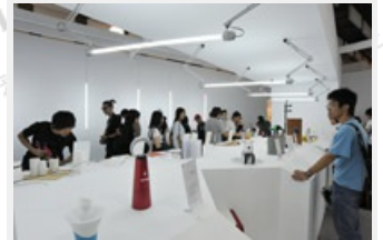
「YODEX 新一代設計展」是全球以學生為主最大型的設計展覽，被國內設計院校視為兵家必爭之地，圖為2009年空間設計大賽金獎，由長庚大學工業設計系脫穎而出。