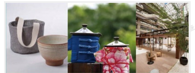
傳統工藝在臺灣已發展數10年，近年消費趨勢逐漸朝向天然環保與東方，其中又以陶瓷、竹、原民工藝、客家工藝最具經濟潛力。