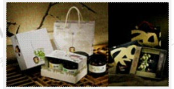
配合農村旅遊及消費者需求，開發具產地特色之旅遊伴手禮。