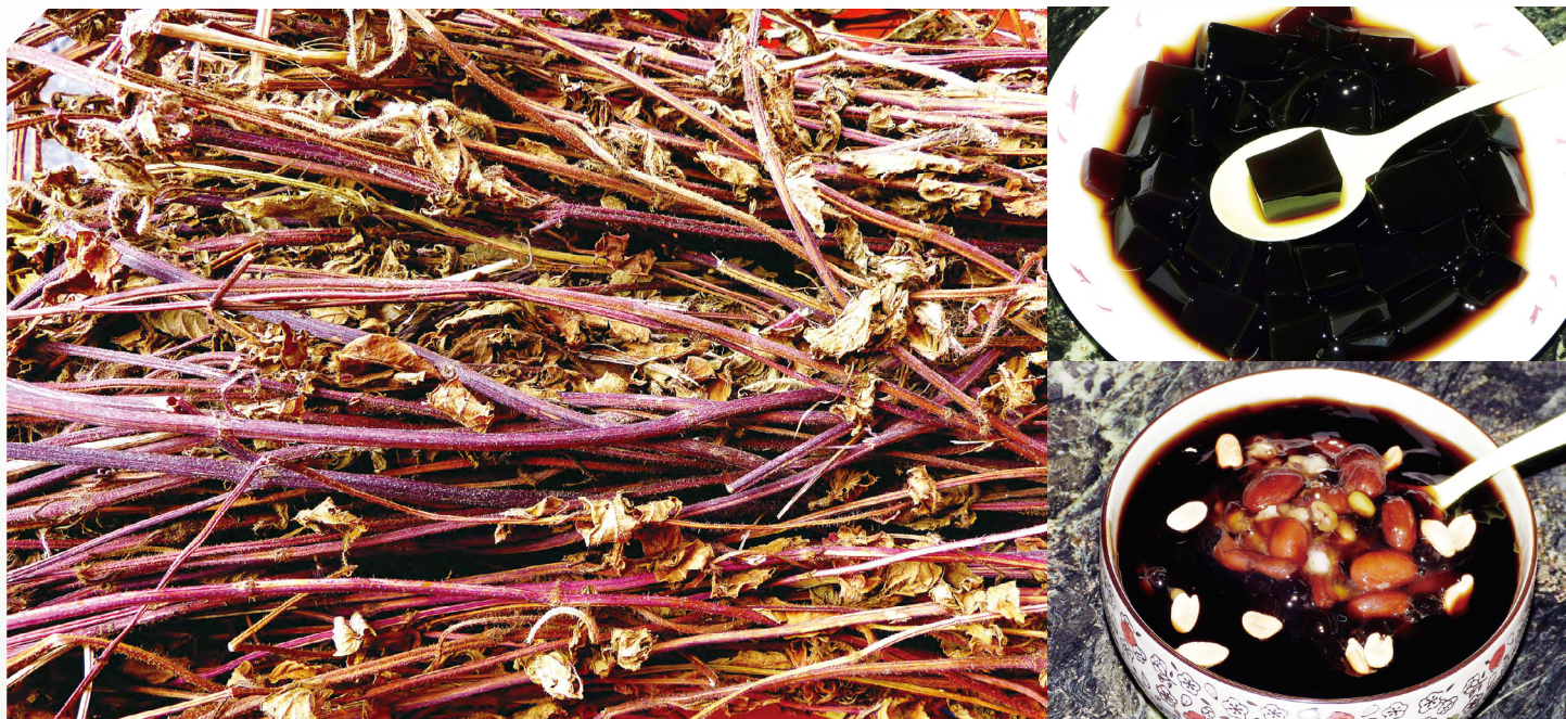
市坊售賣的仙草乾、仙草冰與燒仙草。

暑清熱，為盛夏時節人們的最愛。近年食品界更研發出即溶仙草粉，加入熱開水，與花生、芋圓及紅豆合食，即成為消費者冬季最喜愛的「燒仙草」。以仙草入菜，仙草燉雞湯、燉排骨，更成為人們的養生祕訣。因此，仙草產品可說一年四季都極受歡迎。