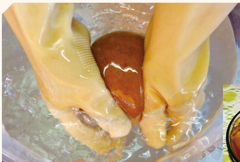
因愛玉富含果膠，和水中鈣離子結合後可成為果凍，因此農民會搓揉愛玉籽，透過「洗愛玉」來產出愛玉凍。

仙草分布於全臺海拔 1 千 2 百公尺以下山麓，主要栽培地在新竹關西、嘉義水上與中埔、彰化二水及苗栗銅鑼等，另外