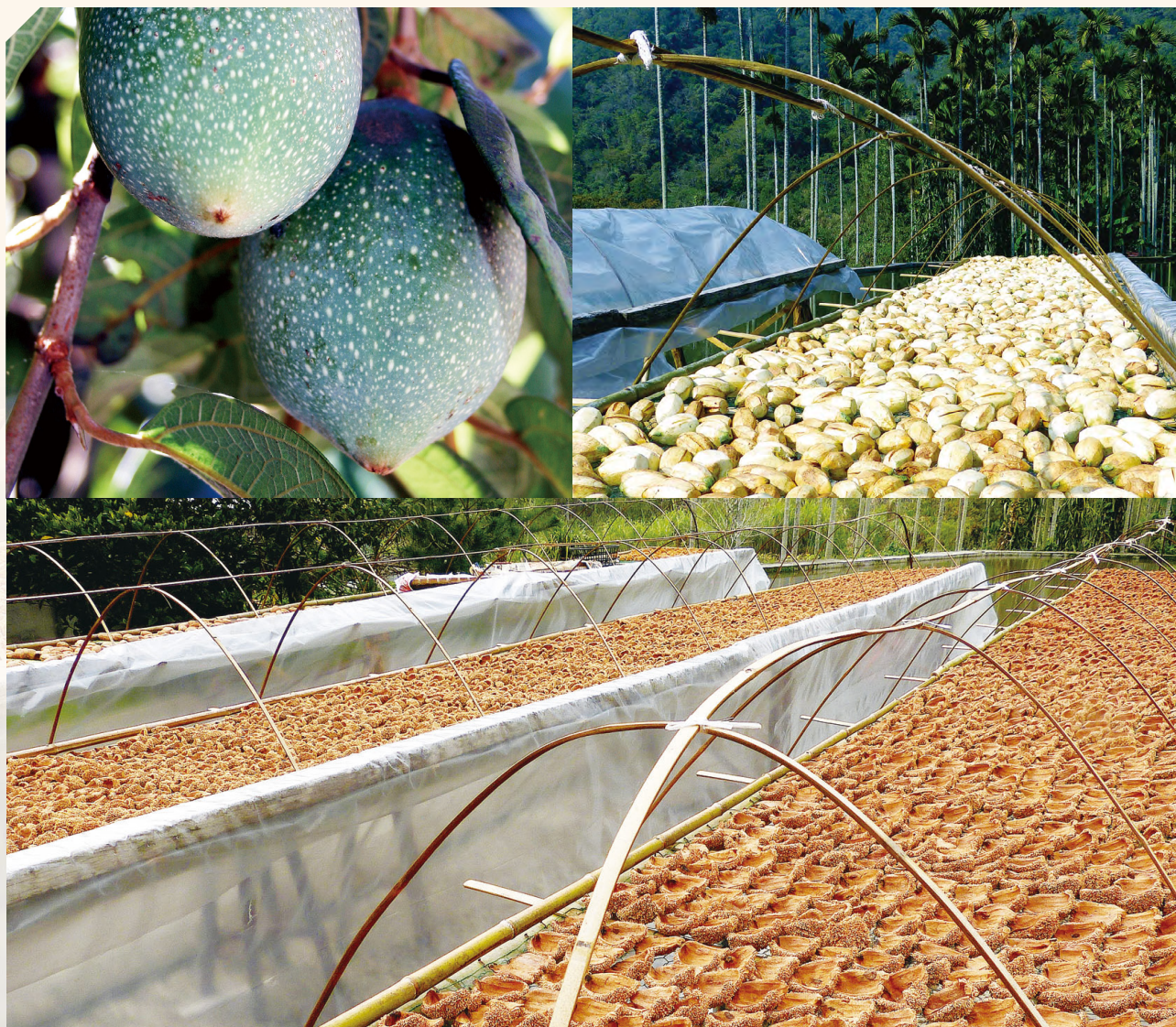
愛玉果實形似土芒果，其果實經去皮曝曬後，即可製為民眾熟悉之愛玉。

有次這位商人趕路口渴，在涉過溪流時，隨手掬起河水飲用時，卻有股沁涼心脾的感覺，仔細一瞧，是彷彿結凍般的東西；商人再四下觀察，發覺是溪畔大樹上藤蔓成熟的果實掉落溪中，所分泌出來的果膠。腦筋靈光的商人，便摘取一些愛玉果實回家，經過一番揉洗，果實中分泌出大量果膠，頃刻間就凝結成果凍，再佐以糖水食用，風味奇佳。