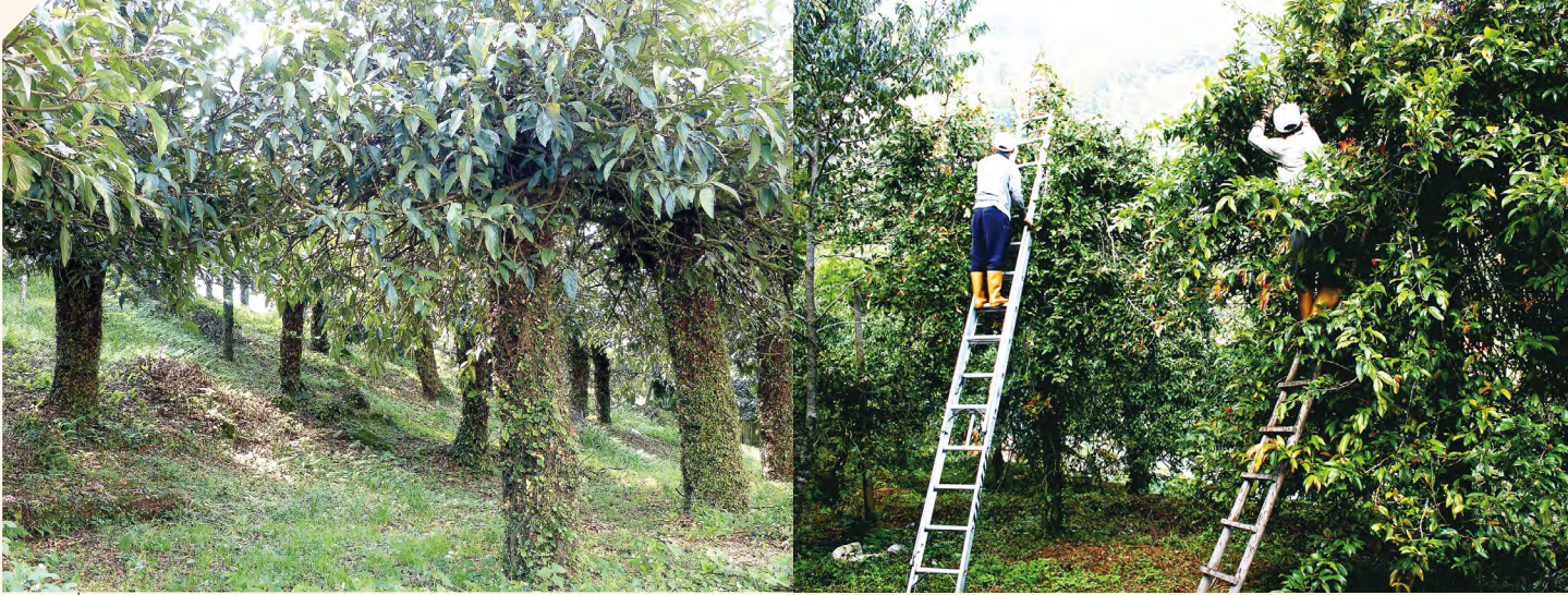
嘉義縣阿里山區人工栽植愛玉園，利用梯子爬高採收愛玉果實。

商人有女，名為「愛玉」，芳齡 15，楚楚可人。他讓女兒愛玉賣起這個果凍，吃過的人都說讚，但都不知道它的名字；由於客人習慣說：「愛玉，來一碗」，久而久之，大家便以愛玉稱之。