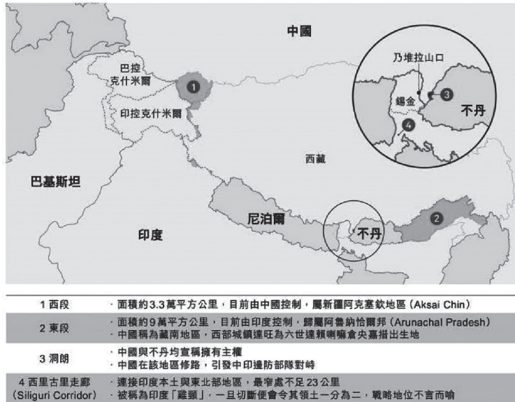
圖 1：陸印邊境爭議概略圖