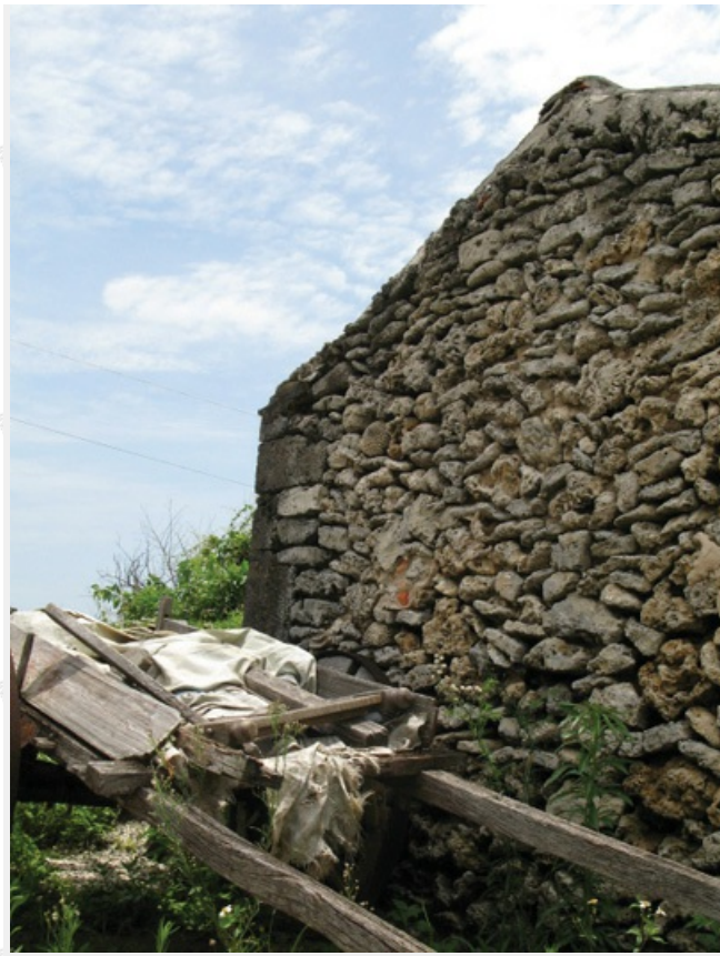
以咾咕石搭建而成的古厝