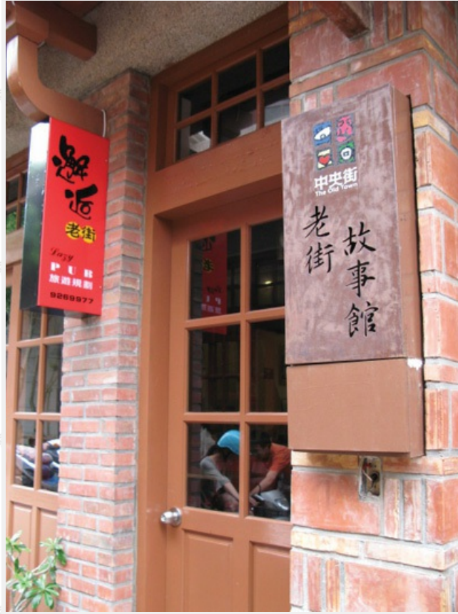
澎湖第一大街—中央街

民國六十年代，縣政府為挽救中央街逐漸老舊凋敝的頹勢，雖然開闢了惠民和惠安等兩條新的計畫道路，卻不但無法重建中央街的商業活力，反而破壞了中央街原有的格局。七十三年，中央街經內政部指定為歷史街區保存區之後，由於缺乏積極的作為，又限制屋舍的改建，更導致了屋舍傾倒和空屋率的上升。八十四年時期，中央街及一巷僅剩四十六戶人家，其中僅有的十三家店戶也只能靠一些棉被店、布行、裁縫店、化粧品行及餅舖等民生性質的生意，繼續守著媽宮「街內」的黃昏。近年由於政府大力推展觀光事業，才讓中央街的商家生意又開始蓬勃發展。