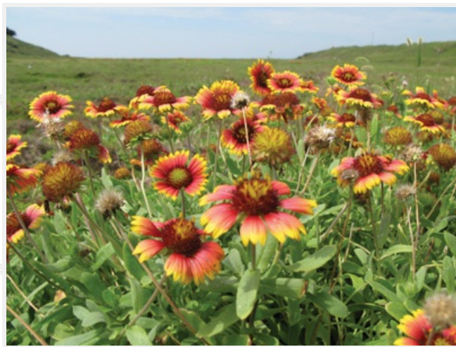
遍佈澎湖的小菊花

二崁陳宅古厝，以當地咾咕石與玄武岩為牆身，支撐屋頂結構，並以彩繪瓷磚、交趾陶、泥塑等裝飾，平房、門窗屋簷，完全閩南古式，為民風淳樸的澎湖與二崁地區增添傳統工藝之美。古色古香、莊嚴樸素，特殊風格的咾咕石古厝群是這裡的特色，少數的居民充滿著純樸，寂靜的宅院卻有著村民的濃情，是追古思情的好地方。