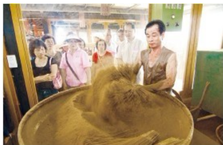
地方文化館－嘉義縣新港香藝文化館

新港香藝文化館以多元的角度來介紹香，挑戰大家的知識與常識，不論是傳說的神話故事、師傅的示範、遊客DIY，從傳統的製香到體驗香料民宿，在新港香藝文化館裡都可以感受到。