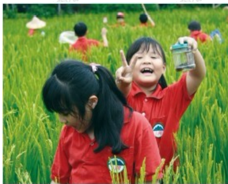
地方文化館－苗栗縣山水米有機稻場 －稻田體驗

苑裡鎮是苗栗縣的穀倉，上百年的種稻歷史，使苑裡的稻米不但質好量多，特別的是還能靠鴨子種出全臺頂尖好吃的有機米－「鴨間稻」。這不僅是農業，也是文化。苗栗縣地方文化館「有機稻場」以鴨間稻為教育素材，結合農民學堂推廣有機種植，以對大地的友善態度，配合小學鄉土教學讓孩童親近土地並認識環境，推廣的不只是健康與養生的有機農業，更重要的是有機生活對環境友善、對下一代負責的「態度」。