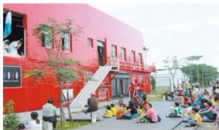
地方文化館－臺東表演藝術館 －民眾在紅牆前看戲