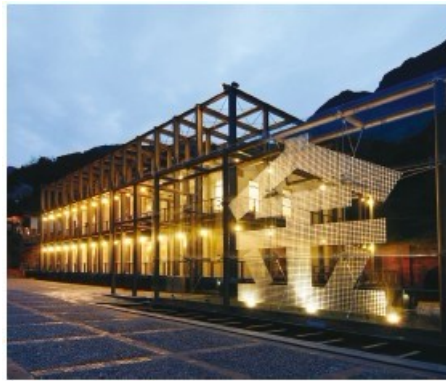
地方文化館－新北市黃金博物館

園區位在桃花源般的山城，即使一年有超過200天的陰雨，絡繹不絕的遊客仍證明它受歡迎的程度（2011年超過100萬參觀人次）。館內220公斤重的金磚，看得到、摸得到，卻帶不走，更讓人津津樂道。回娘家的老礦工看著這座博物館重現當年情景，也說未曾想過礦坑也可以當博物館，讓挖金的故事變成傳奇。