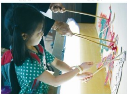
地方文化館－高雄市皮影戲館 －親手玩皮影戲

2009年提出「阿緱文化生活圈」，以該館在屏東市豐厚的城市紋理研究基礎，進一步向外發展串連，計有8處古蹟及歷史建築、6處地方文化館展演空間，及15處社區營造點，加上影響屏東街發展甚鉅的糖廠與機場，以及特色聚落的耆民信仰中心等。「阿緱文化生活圈」藉由地方居民、文化活動、文化據點，串起灑落在城市各角落的故事，逐步串聯出完整的城市文化網絡。