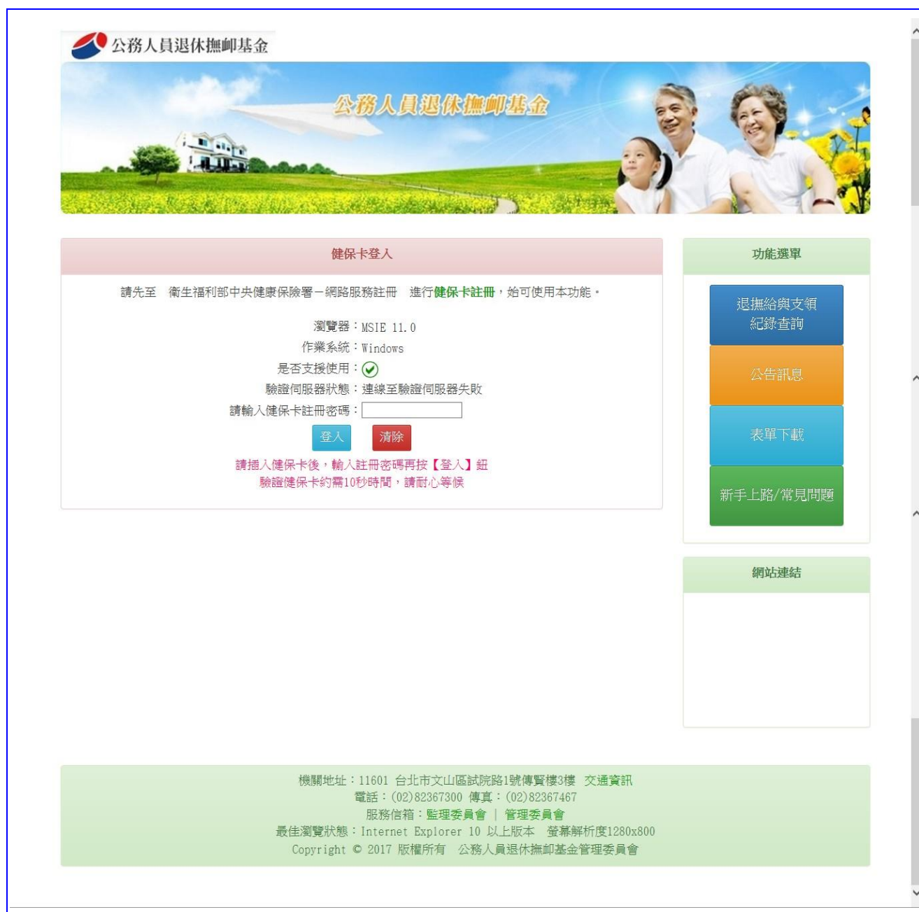
【圖表 1】退撫給與支領紀錄查詢系統-登入畫面

本系統僅提供領受人查詢支領紀錄，請連結至 https://www.payinfo.fund.gov.tw ，將健保卡插入讀卡機後，輸入健保卡註冊密碼登入系統，由於系統將與健保署連線進行驗證，過程可能需要 10~15 秒進行讀卡及驗證，敬請稍後。