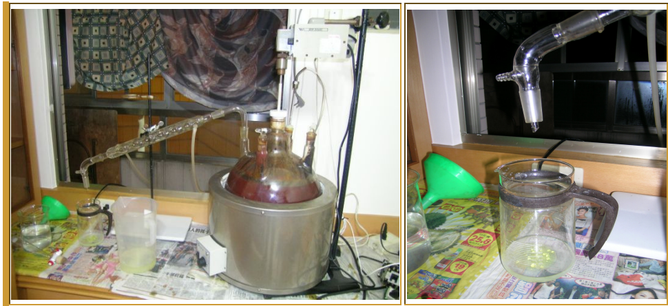
甲基安非他命地下製造工廠(紅 O 法製程)