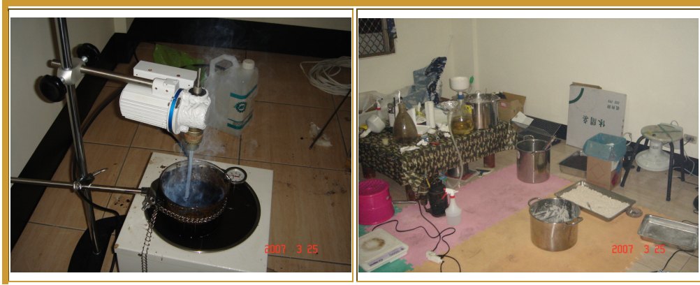
愷他命地下製造工廠