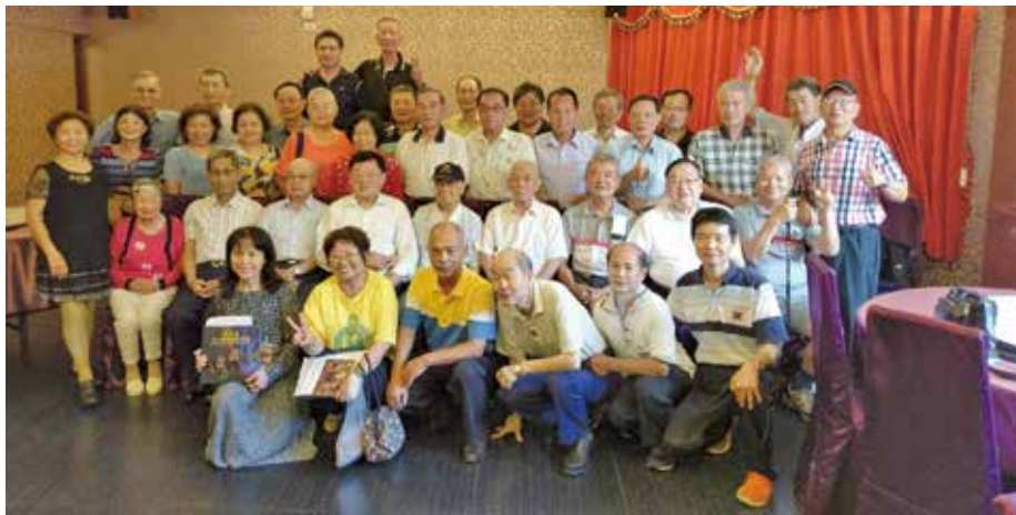
第 18 聯絡組聯誼活動合照